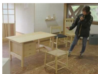
デスク・スツール製作