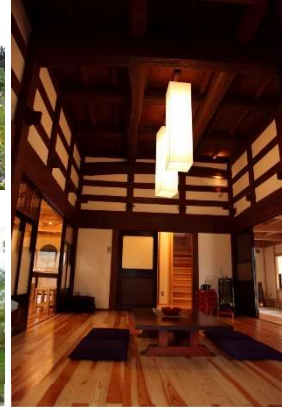
古民家の設え(枠の内づくり)