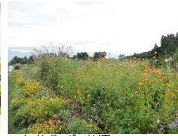
一年草ポーター花壇