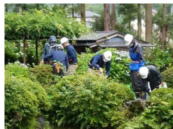
黒部市指定名勝「松桜閣庭園」剪定