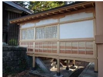
「鶴坂神社吊殿」改築（富山市）：伝統的木組み構法による木造建築