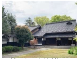
明治期の富山の伝統建築

住まいとその環境づくりを中心に、それぞれの分野の職藝学院講師陣による講義を行います。