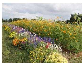
とやまスローライフ市民農園花壇（富山市）：有機無農薬で管理するガーデン