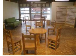
手仕事による家具・建具