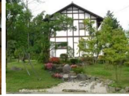
伝統構法による住宅と庭園