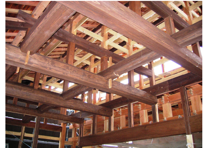
伝統構法にこだわった家づくり (島崎オーバーマイスター)